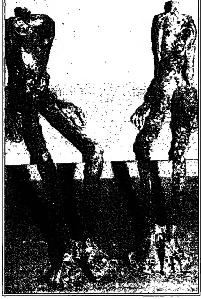
ثلاثة اصنام للثلاثه

وان تكون موجودا هذا يعني ان تصنع لركب افاق الفكر، وكل الاسماء، ولكي تكون بشرا، لا تتفكر الصنفة ولا المير، وتهدد الكلام على صلاتها ما لا يترك لها فرصة للراحة، وتنتقل في البحث عناء، تشد الوج، تسرق الخيوط، ثم تصير بعد برتة ايها الجسد منكم، فتهتم اهانكا يا حلا، ففعل عينا كتهما ثانية لتقول: ارقام وحدها تتوازن مهما كانت الارض رخوة.